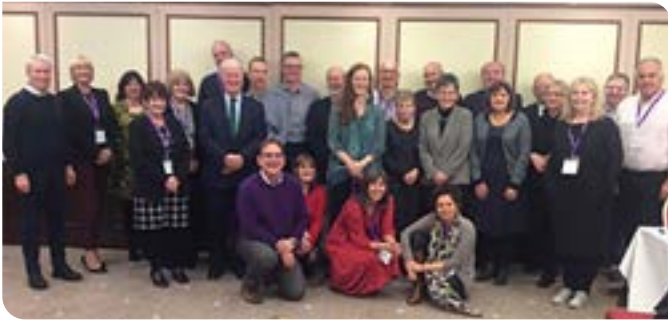
Y garfan gyntaf o Aelodau Annibynnol a Hwyluswyr y Rhaglen